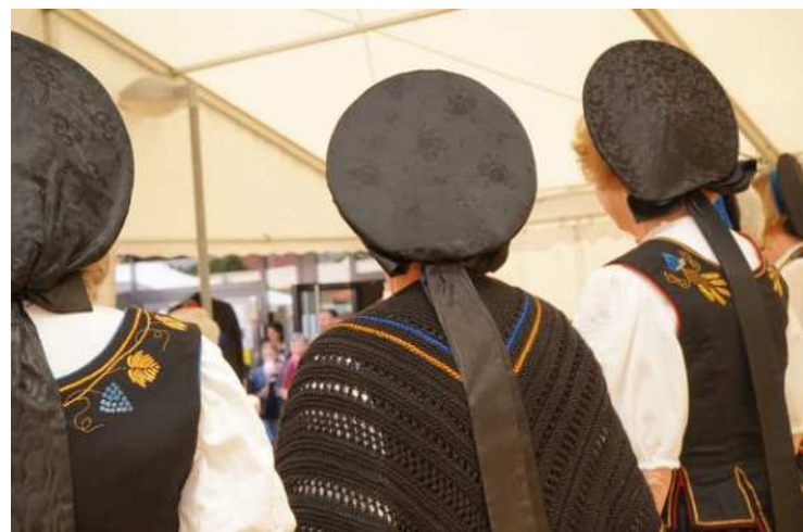
Trachtenschau in Rickenbach/ZH: Weinländer Festtagshauben

Ich organisiere eine Trachtenschau mit Zürcher Trachten (siehe Box) und bin für das kantonale Bild am Festumzug verantwortlich. So bin ich bis im Sommer gut ausgelastet (lacht). Aber ich denke, der Einsatz lohnt sich. Ich freue mich sehr aufs Eidgenössische Trachtenfest in Zürich.