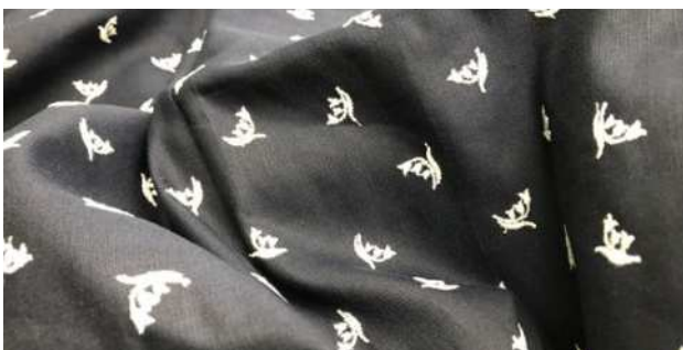
Der neue Zürcher Werktagstrachten-Stoff

Der Stoff kann für Fr. 152.-/Laufmeter im Heimatwerk Bauma bezogen werden. www.heimat-werk.ch