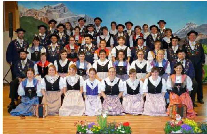
Die Trachtengruppe Spiringen wird am Samstag, 29. Juni 2024, um 13:20 Uhr auftreten. Das detaillierte Programm mit allen Gruppen und Plätzen wird ab Mitte Mai online sein.

Christoph Weber, Freie Bühnen ETF 2024, freiebuehnen@trachtenfestzuerich.ch