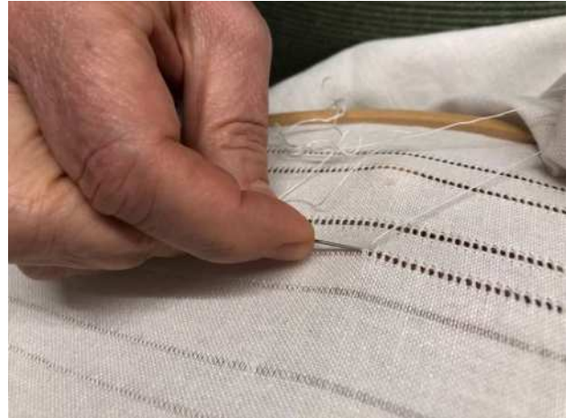
Hohlsaumstickerei an einer Trachtenbluse