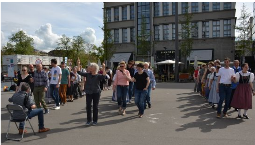
Welttanztag 2023 in Zürich

5. - 7. Schweizerische Trachtenvereinigung – Fédération nationale des costumes suisses: Schweizerisches Trachtenchorfest in Sursee – Chorales suisses en costume à Sursee, Auskunft: 055 263 15 63 oder info@trachtenvereinigung.ch